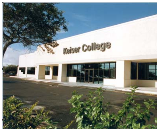
Keiser University, Melbourne

El campus principal de Keiser University está ubicado en el distrito residencial de Fort Lauderdale, en el centro del corredor de alta tecnología del condado de Broward. La universidad se encuentra aproximadamente a una milla al oeste de la carretera interestatal I-95 y aproximadamente a tres millas de las famosas playas de Fort Lauderdale. El edificio de la universidad fue rediseñado tomando en consideración las necesidades específicas de los programas de Keiser College. El edificio abarca más de 100,000 pies cuadrados de laboratorios, aulas y oficinas climatizados y bien iluminados. La universidad cuenta con una biblioteca, una sala de estar para los estudiantes y un centro de computación. Keiser University cuenta con un amplio estacionamiento gratuito y se encuentra ubicado sobre una importante ruta de autobuses. Todo el equipo utilizado en Keiser University es equiparable con los estándares de la industria y cumple con los objetivos del programa de manera efectiva.