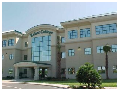
Keiser University, Campus de Sarasota

El campus de Tallahassee se encuentra en la pujante área noreste del condado de León. El campus está ubicado a menos de 15 minutos de la sede del Gobierno estatal y a aproximadamente 15 millas del nuevo aeropuerto de la ciudad, en la carretera interestatal I-10 y Thomasville Road. El campus fue rediseñado tomando en consideración las necesidades específicas de los programas de Keiser University. El campus de Tallahassee incluye cuatro edificios que abarcan aproximadamente 50,000 pies cuadrados de laboratorios, aulas y oficinas climatizados y bien iluminados. Entre ellos se encuentra el Instituto de Arte Culinario Capital de Keiser University, una instalación culinaria moderna de 16,000 pies cuadrados que proporciona a los estudiantes una cocina de producción, cuatro laboratorios de instrucción culinaria, aulas y unas instalaciones multiuso de tecnología de avanzada con dimensiones suficientemente espaciaosas para banquetes, seminarios y eventos especiales. El complejo de Tallahassee también tiene una biblioteca, una sala de estar para los estudiantes y un centro de computación. Keiser University cuenta con un amplio estacionamiento gratuito y bien iluminado en las cercanías de las aulas. Todo el equipo utilizado en Keiser University es equiparable con los estándares de la industria y cumple con los objetivos del programa de manera efectiva.