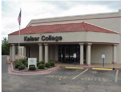
Keiser University, Campus de Tallahassee

El campus de Tallahassee se encuentra en la pujante área noreste del condado de León. El campus está ubicado a menos de 15 minutos de la sede del Gobierno estatal y a aproximadamente 15 millas del nuevo aeropuerto de la ciudad, en la carretera interestatal I-10 y Thomasville Road. El campus fue rediseñado tomando en consideración las necesidades específicas de los programas de Keiser University. El campus de Tallahassee incluye cuatro edificios que abarcan aproximadamente 50,000 pies cuadrados de laboratorios, aulas y oficinas climatizados y bien iluminados. Entre ellos se encuentra el Instituto de Arte Culinario Capital de Keiser University, una instalación culinaria moderna de 16,000 pies cuadrados que proporciona a los estudiantes una cocina de producción, cuatro laboratorios de instrucción culinaria, aulas y unas instalaciones multiuso de tecnología de avanzada con dimensiones suficientemente espaciaosas para banquetes, seminarios y eventos especiales. El complejo de Tallahassee también tiene una biblioteca, una sala de estar para los estudiantes y un centro de computación. Keiser University cuenta con un amplio estacionamiento gratuito y bien iluminado en las cercanías de las aulas. Todo el equipo utilizado en Keiser University es equiparable con los estándares de la industria y cumple con los objetivos del programa de manera efectiva.