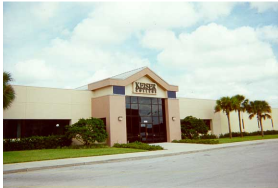
Keiser University, Campus de Lakeland

El campus de Daytona Beach se encuentra ubicado en el Business Park Boulevard, una milla al norte del circuito de Daytona y ofrece modernos laboratorios donde los estudiantes pueden poner en práctica inmediatamente lo que aprenden en un entorno realista. El campus está bien preparado para satisfacer las necesidades de los estudiantes, hasta bien avanzado el próximo siglo. En el campus de Daytona Beach, los estudiantes se benefician de la filosofía de combinar la experiencia práctica con una sólida preparación académica.