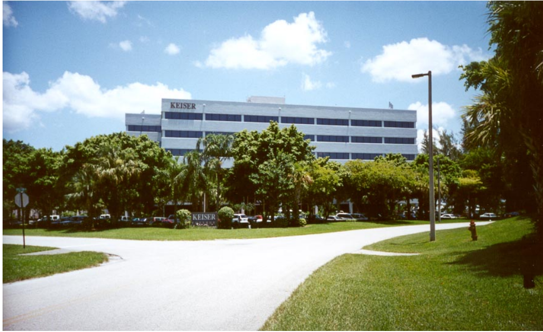
Campus principal de Keiser University, Fort Lauderdale, FL