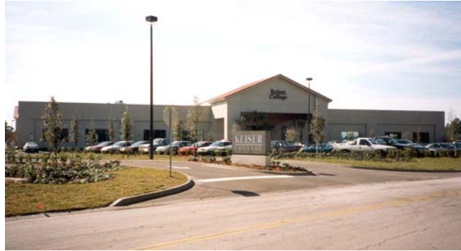
Keiser University, Campus de Daytona Beach

personal pueden disfrutar del paisaje que ofrecen los más de 20 acres del terreno de la universidad bordeados por el lago Osprey. Las instalaciones mejoran la experiencia práctica junto con una sólida preparación académica que permite capacitar a los estudiantes para los desafíos profesionales del siglo XXI.