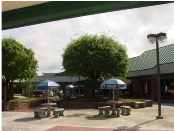
Keiser University, Campus de Port St. Lucie

El campus de Jacksonville se encuentra en el área sur de Jacksonville, en el Parkway Place Corporate Center, 6700 Southpoint Parkway. Está emplazado en un precioso edificio de 23,000 pies cuadrados con amplio estacionamiento. El edificio se diseñó tomando en consideración las necesidades específicas de los programas de Keiser University. El campus de Jacksonville posee una biblioteca, una sala de estar para los estudiantes, varias aulas y laboratorios médicos y de computación. La sede de Keiser University en Jacksonville cuenta con un estacionamiento gratuito y bien iluminado, contiguo a las aulas. En el campus de Jacksonville, los estudiantes se benefician de la filosofía de combinar la experiencia práctica con una sólida preparación académica.