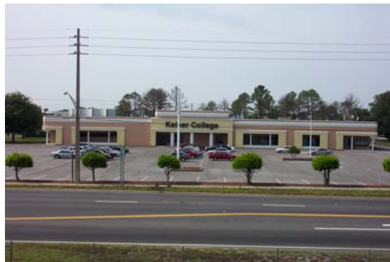
Keiser University, Campus de Orlando

El campus de Kendall está emplazado en un edificio de dos pisos de 27,000 pies cuadrados, ubicado en el corazón de Kendall (una zona residencial al suroeste de Miami, en la Florida) dentro del centro comercial Town and Country. El campus cuenta con una biblioteca, una sala de estar para los estudiantes y un patio en el segundo piso con vista a un lago artificial, tres laboratorios médicos, cuatro laboratorios de computación, cómodas aulas bien iluminadas y acceso inalámbrico a Internet. Todo el equipo utilizado en Keiser University es equiparable con los estándares de la industria y cumple con los objetivos del programa de manera efectiva. Los estudiantes en la sede de Kendall se benefician de la filosofía de combinar la experiencia práctica con una sólida preparación académica.