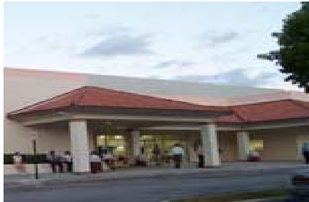
Keiser University, Campus de Pembroke Pines

El campus de West Palm Beach se encuentra en West Palm Beach, en la Florida. La Universidad está ubicada cerca de la autopista Turnpike. Cuenta con más de 40,000 pies cuadrados de aulas, laboratorios y oficinas climatizados y bien iluminados que brindan a los estudiantes un entorno de aprendizaje moderno y cómodo. Todo el equipo utilizado en la universidad es equiparable con los estándares de la industria y cumple con los objetivos del programa de manera efectiva.