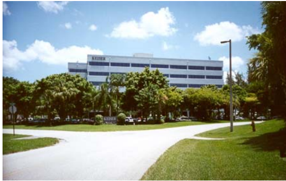
Keiser University, campus de Fort Lauderdale

El campus principal de Keiser University está ubicado en el distrito residencial de Fort Lauderdale, en el centro del corredor de alta tecnología del condado de Broward. La universidad se encuentra aproximadamente a una milla al oeste de la carretera interestatal I-95 y aproximadamente a tres millas de las famosas playas de Fort Lauderdale. El edificio de la universidad fue rediseñado tomando en consideración las necesidades específicas de los programas de Keiser College. El edificio abarca más de 100,000 pies cuadrados de laboratorios, aulas y oficinas climatizados y bien iluminados. La universidad cuenta con una biblioteca, una sala de estar para los estudiantes y un centro de computación. Keiser University cuenta con un amplio estacionamiento gratuito y se encuentra ubicado sobre una importante ruta de autobuses. Todo el equipo utilizado en Keiser University es equiparable con los estándares de la industria y cumple con los objetivos del programa de manera efectiva.