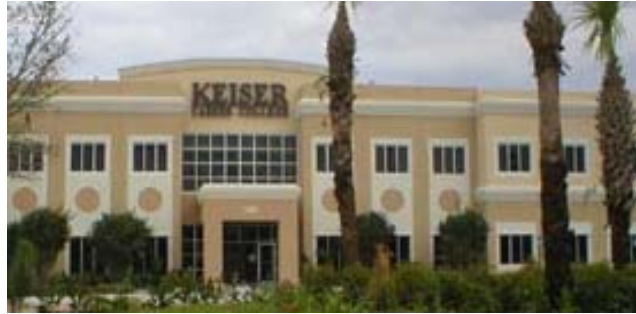
Keiser University, Campus de West Palm Beach

El campus de West Palm Beach se encuentra en West Palm Beach, en la Florida. La Universidad está ubicada cerca de la autopista Turnpike. Cuenta con más de 40,000 pies cuadrados de aulas, laboratorios y oficinas climatizados y bien iluminados que brindan a los estudiantes un entorno de aprendizaje moderno y cómodo. Todo el equipo utilizado en la universidad es equiparable con los estándares de la industria y cumple con los objetivos del programa de manera efectiva.