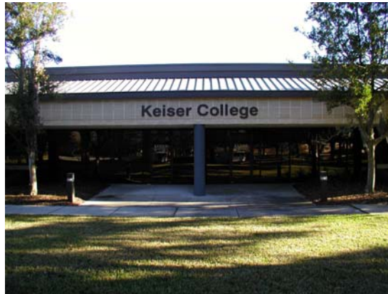
Keiser University, Campus de Jacksonville

El campus de Jacksonville se encuentra en el área sur de Jacksonville, en el Parkway Place Corporate Center, 6700 Southpoint Parkway. Está emplazado en un precioso edificio de 23,000 pies cuadrados con amplio estacionamiento. El edificio se diseñó tomando en consideración las necesidades específicas de los programas de Keiser University. El campus de Jacksonville posee una biblioteca, una sala de estar para los estudiantes, varias aulas y laboratorios médicos y de computación. La sede de Keiser University en Jacksonville cuenta con un estacionamiento gratuito y bien iluminado, contiguo a las aulas. En el campus de Jacksonville, los estudiantes se benefician de la filosofía de combinar la experiencia práctica con una sólida preparación académica.