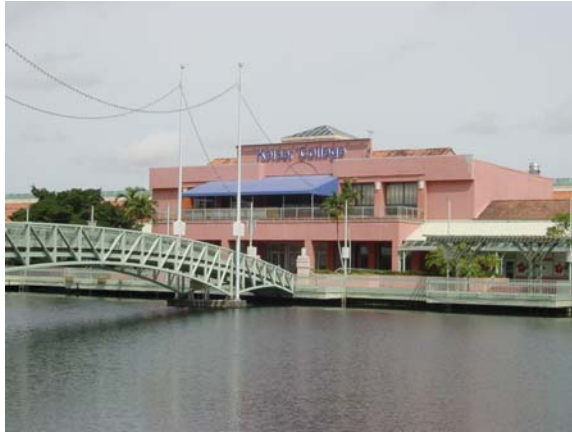
Keiser University, Campus de Kendall

El campus de Kendall está emplazado en un edificio de dos pisos de 27,000 pies cuadrados, ubicado en el corazón de Kendall (una zona residencial al suroeste de Miami, en la Florida) dentro del centro comercial Town and Country. El campus cuenta con una biblioteca, una sala de estar para los estudiantes y un patio en el segundo piso con vista a un lago artificial, tres laboratorios médicos, cuatro laboratorios de computación, cómodas aulas bien iluminadas y acceso inalámbrico a Internet. Todo el equipo utilizado en Keiser University es equiparable con los estándares de la industria y cumple con los objetivos del programa de manera efectiva. Los estudiantes en la sede de Kendall se benefician de la filosofía de combinar la experiencia práctica con una sólida preparación académica.